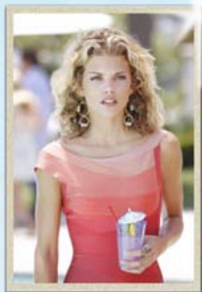
Anna Lynne McCord – Naomi Clark

Acteurs de la nouvelle génération et valeurs sûres se côtoient dans les épisodes de “ Beverly Hills 90210 : nouvelle génération ”. La série joue ainsi la carte du contraste pour séduire les fans de la première heure et les adolescents d’aujourd’hui.